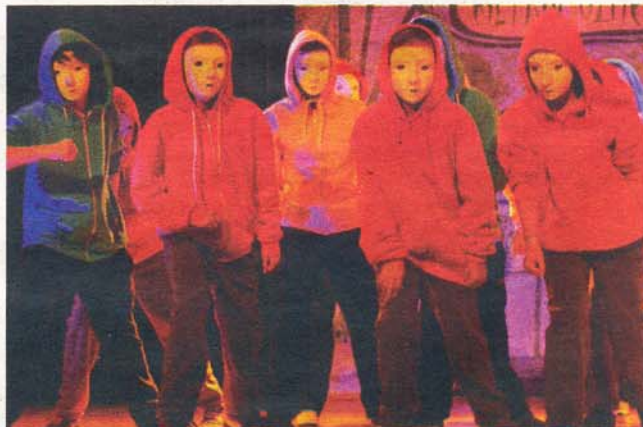
Les danseurs et danseuses de hip-hop de l'association Terpsichore étaient également au rendez-vous de ce gala.