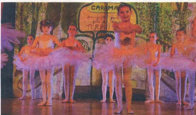
Les petits rats de l'opéra ont été très applaudis.